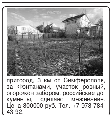
пригород, 3 км от Симферополя, за Фонтанами, участок ровный, огорожен забором, российские документы, сделано межевание. Цена 800000 руб. Тел. +7-978-784-43-92.

ПРИГОРОД (5 км от города в сторону Николаевки, за Дубками), участок 10 соток. Первая линия, хороший подъезд, эл-во, вода подведены. Без посредников. Цена 800 тыс. руб. Тел. +7-978-809-80-79.