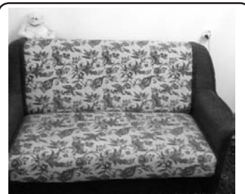
Диван шикарный, раскладывающийся вперед, цвет «под малахит». Цена 6000 руб. Торг. Тел. +7-978-829-63-04.

ДИВАН угловой, в хорошем состоянии. Цена 10 тыс. руб. Тел. +7-978-708-09-64.