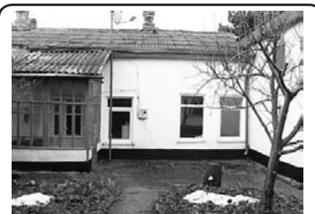
СТАРЫЙ КРЫМ , уютный дом, об/пл. 26 кв. м, цена 900 тыс. руб. Тел. +7-978-784-43-92.

СОЛНЕЧНАЯ ДОЛИНА , Судак, участок 8 соток, расположен на крайней улице, тыльная сторона выходит на арык и горы. Дом новый (строительство окончено в 2014 г.), двухэтажный, с подвалом и террасой, великолепный вид, об/пл. 124 кв. м. Цена 7300000 руб. Тел. +7-978-108-36-32 (Viber), +38-050-320-97-99 (Viber, Whats App, Telegram), +7-978-012-50-88.